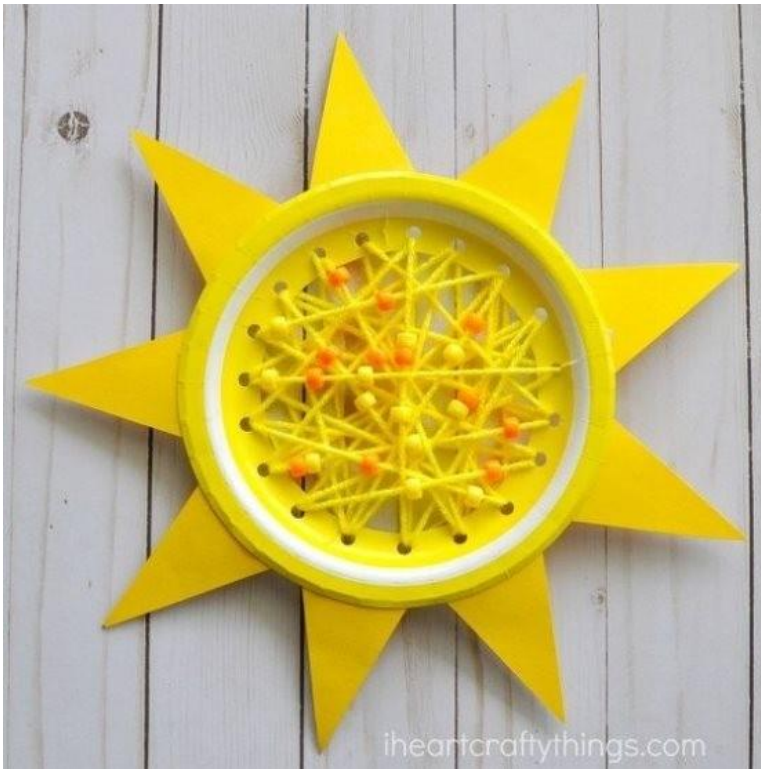
Солнышко или звезда