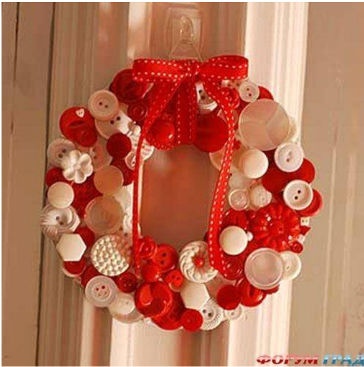
ФОРУМ ГРАД Венок