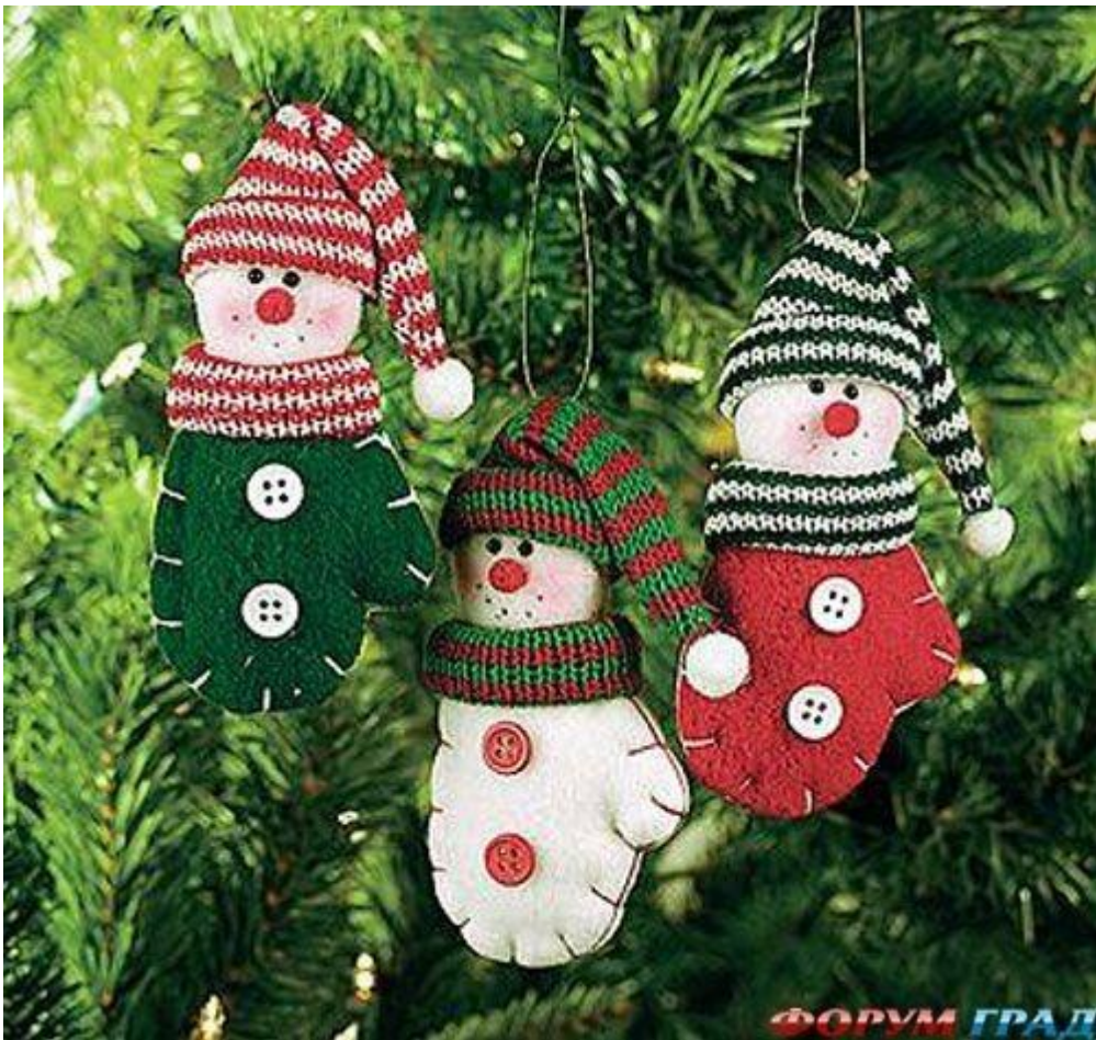
ФОРУМ ГРАД Снеговички